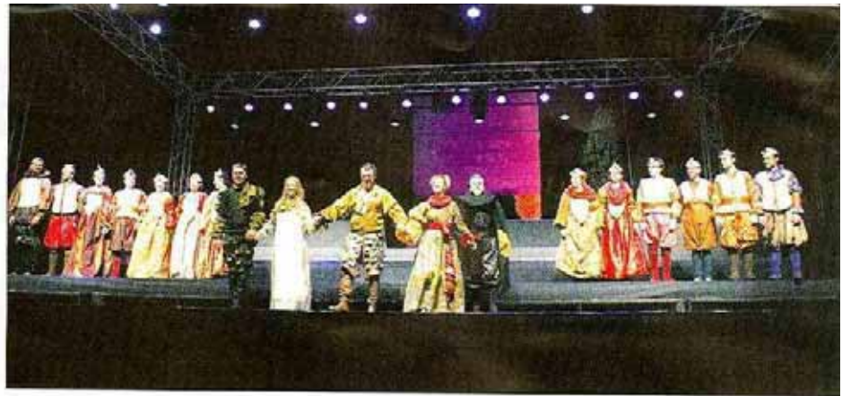
Final de la obra: Los cinco actores principales; detrás de ellos, el coro

El elemento que caracteriza este tipo de interpretación es el coro. En el teatro griego el coro es la manera en que podía describirse lo que el personaje piensa y siente, es una especie de analista. También sirve para describir lo que no se ve en la obra, es una especie de narrador, informa al público de lo que no vio. Otra razón es que el