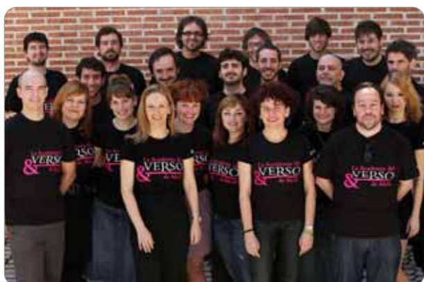
Primera promoción, 2011.

Con este proyecto no hablamos de la producción de un gran espectáculo, ni mucho menos. Sí que se trata, no obstante, de producir grandes actores, actores formados en el verso, sobre autores muy significados.