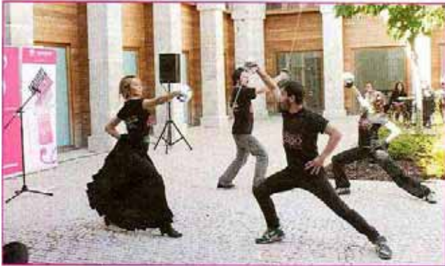
La esgrima es fundamental en la preparación de los actores y actrices de la Academia del Verso