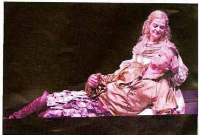
Doña Inés compuso al final de la obra una Piedad con Don Juan