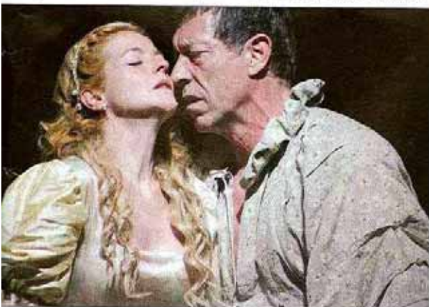
Don Juan y Doña Inés en "la escena del sofá"

Por eso, una de las peticiones que nos hicieron a través de PUERTA DE MADRID alguno de los espectadores fue que los escenarios estuvieran a una mayor altura para facilitar la visibilidad de todo el mundo.