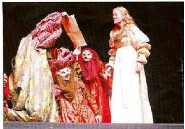
El coro muestra a Doña Inés la carta de Don Juan en el convento