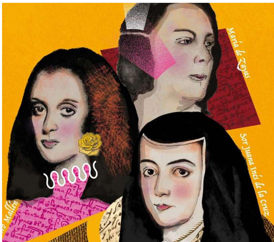
Sor Juana Inés de la Cruz, María de Zayas Sotomayor y Ana Caro Mallén

La pieza Que mujer prodigio soy tocará parte de la vida y obra de Sor Juana Inés de la Cruz, María de Zayas Sotomayor y Ana Caro Mallén en el marco de una competencia por ser las mejores y la elegida para escribir la pieza de la corona de entonces ¿Quién será la ganadora? ¿Una? ¿Las tres...? Para descubrirlo solo deben llevarnos a su teatro, invitarnos a habitarlo y llenarlo de magia con Que mujer prodigio soy .