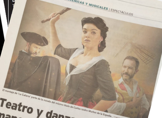
El montaje de 'La Galana' parte de la novela del mismo título de Carlos Isidro Muñoz de la Espada.

FERIA DE LAS ARTES ESCÉNICAS Y MUSICALES | ESPECTÁCULOS