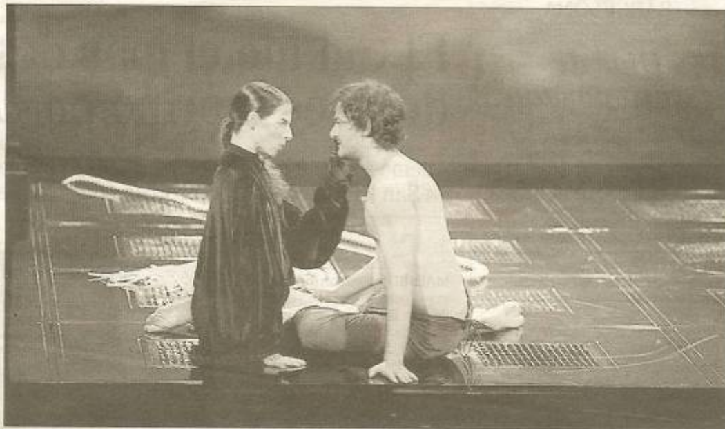
Un momento de la representación de 'El mágico prodigioso' en el Teatro Principal de Zamora.