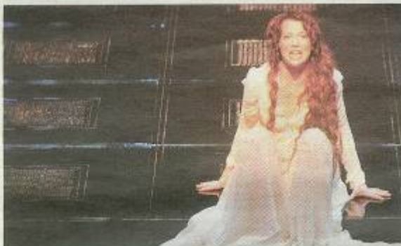
Una escena de "El mágico prodigioso".